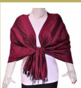
Jacquard Foulards de...

Arrivé sur ce site par hasard, j'ai été surpris du choix et de la qualité des produits, la livraison fut très rapide. Merci